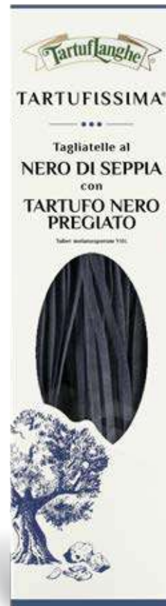
TARTUFISSIMA® Tagliatelle al Nero di Seppia con Tartufo Nero Pregiato (Tuber melanosporum Vitt.) 250g