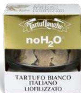
NOH 2 O® TARTUFO BIANCO CRIO-ESSICCATO ( Tuber magnatum Pico ) 2,5g