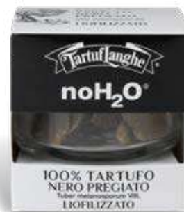
NOH 2 O® TARTUFO NERO PREGIATO CRIO-ESSICCATO ( Tuber melanosporum Vitt. ) 2,5g