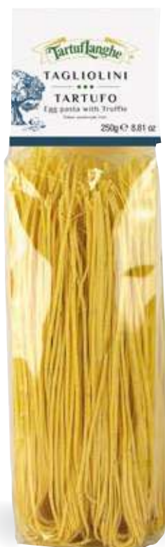
TAGLIOLINI ALL'UOVO CON TARTUFO (Tuber aestivum Vitt.) 250g