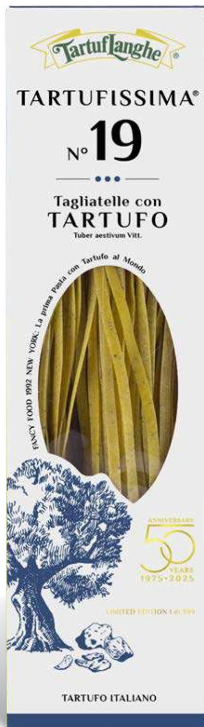
TARTUFISSIMA® N. 19 Tagliatelle con Tartufo 1Kg (2 confezioni da 500g) (Tuber aestivum Vitt.) MAXI FORMATO