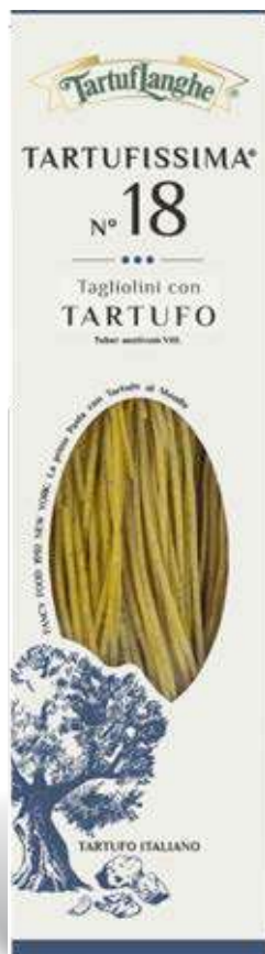
TARTUFISSIMA® N. 18 Tagliolini con Tartufo 250g (Tuber aestivum Vitt.)